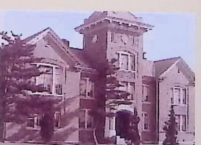
●関西学院原田の森 日本におけるW.R.ランバスの宣教の働きは、1886年に神戸栄光教会を創設したことに始まるが、教育事業として89年に関西学院を神戸の原田の森に創立した。写真(1912年竣工)は、原田の森キャンパスの中でも象徴的な神学館の建物である。