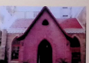
●カテデ教会 南メソヂスト監督教会が、ブラジルのリオデジャネイロに最初に建てた教会で、1882年竣工。W.R.ランバスが、南メソヂスト監督教会の監督として、1911年にこの教会においてブラジル年会を開催した。