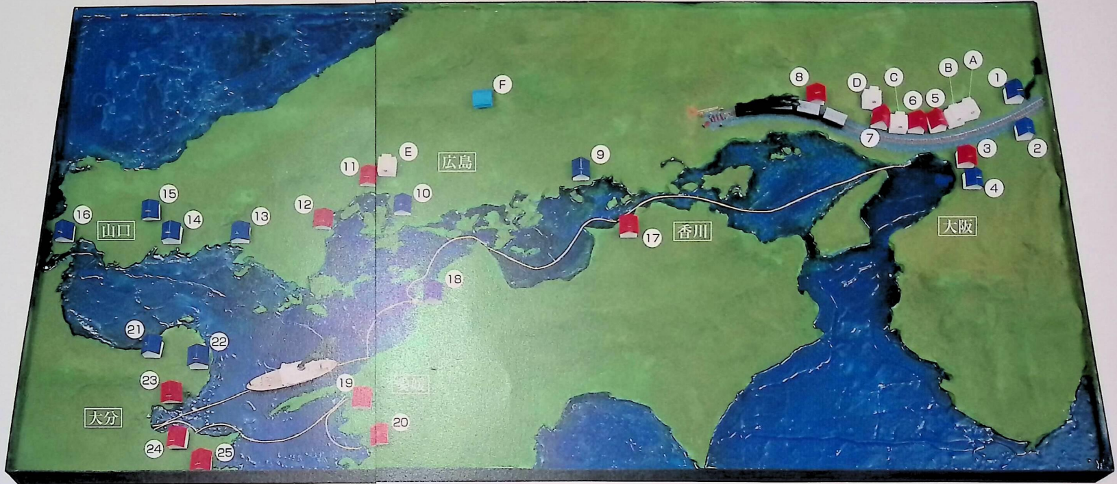
「瀬戸内伝道圏構想」ジオラマ 制作：関西学院大学図書館 監修：神田健次 関西学院大学神学部教授

ランバス滞在中(1886-90年)に創設された13の教会を赤色の屋根で表示し、ランバス離日後に創設された12の教会を青色の屋根で表示している。