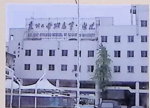
●蘇州病院 1882年に親友W.H.バークと共に開設した蘇州病院は、W.R.ランバスが去った後もバークにより引き継ぎ育てられた。妹ノラはのちにバークの妻となった。この蘇州病院は、現在蘇州大学付属病院となっている。